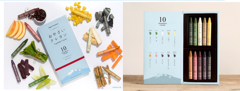
【クレヨンの製造方法】