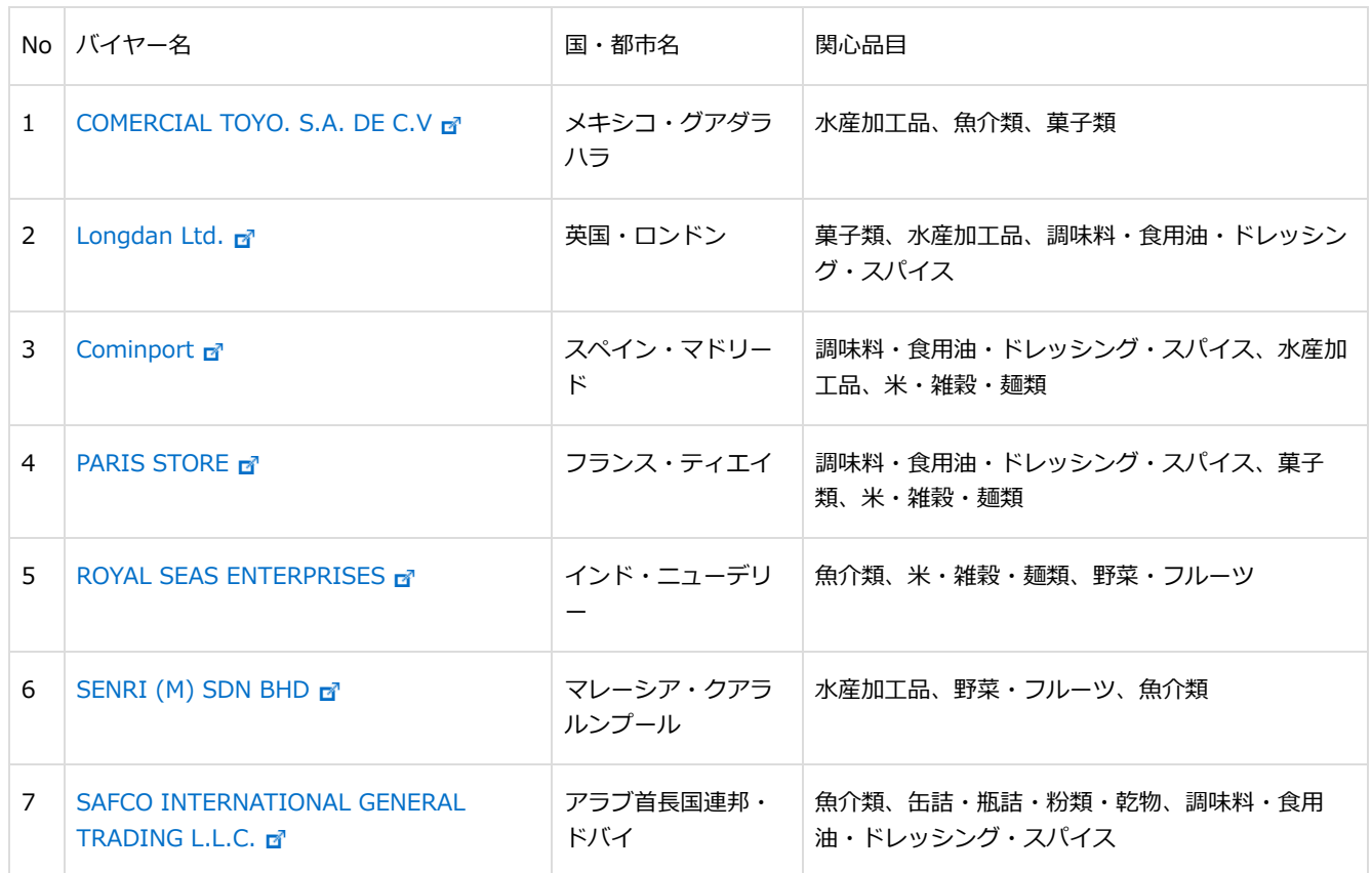
表3：参加バイヤー7社一覧