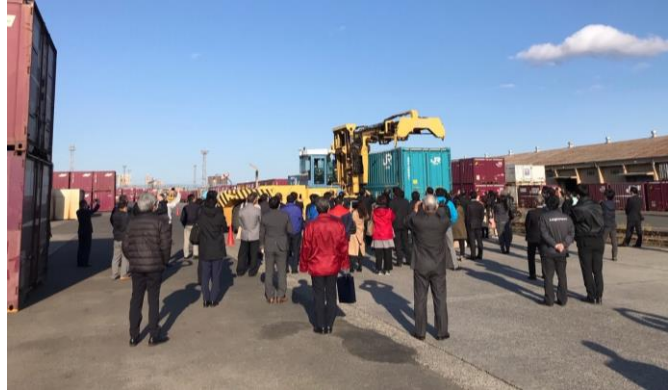
2021年度 鉄道コンテナ見学会の様子(仙台貨物ターミナル駅)