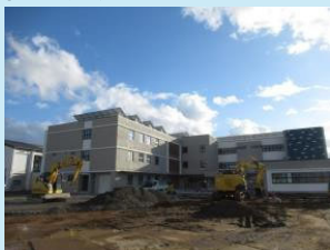
改築中の荒浜小学校現況写真