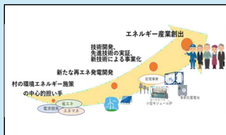
地域エネルギー会社が目指す将来像