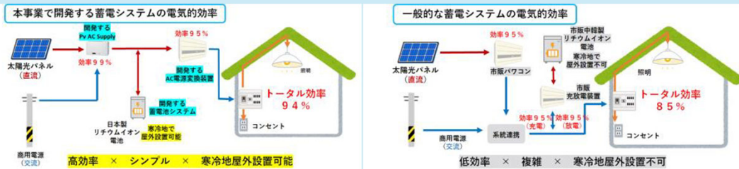
本事業で開発する蓄電システムの電氣的効率 (左) と、一般的な蓄電システムの電氣的効率 (右)

【本資料のお問合せ先】 東北経済産業局資源エネルギー環境部 電力・ガス事業課電源地域振興室 TEL : 022-221-4936