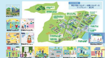
2035年ゼロカーボンシティ実現に向けた2030年将来像