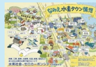
なみえ水素タウン構想 イメージ図