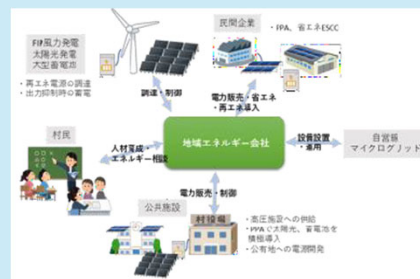
地域エネルギー会社の事業展開イメージ