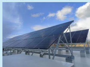
屋上に設置した太陽光発電設備