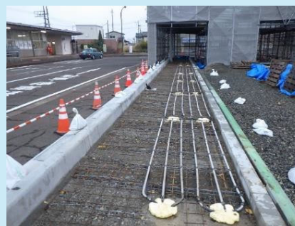
ヒートパイプシステムの施工状況 (令和5年度施工箇所)