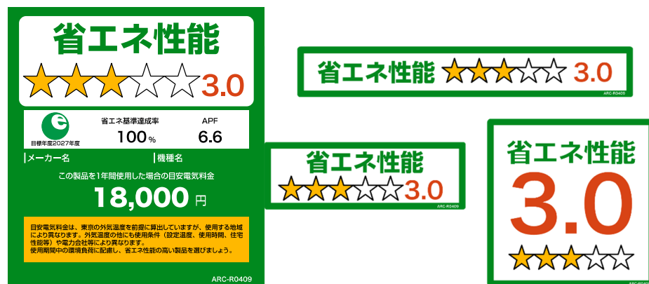
〔図3〕統一省エネラベル※